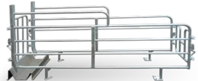
Código 12100-ARG · Metálica de tubos.