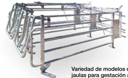
Variedad de modelos de jaulas para gestación abierta.