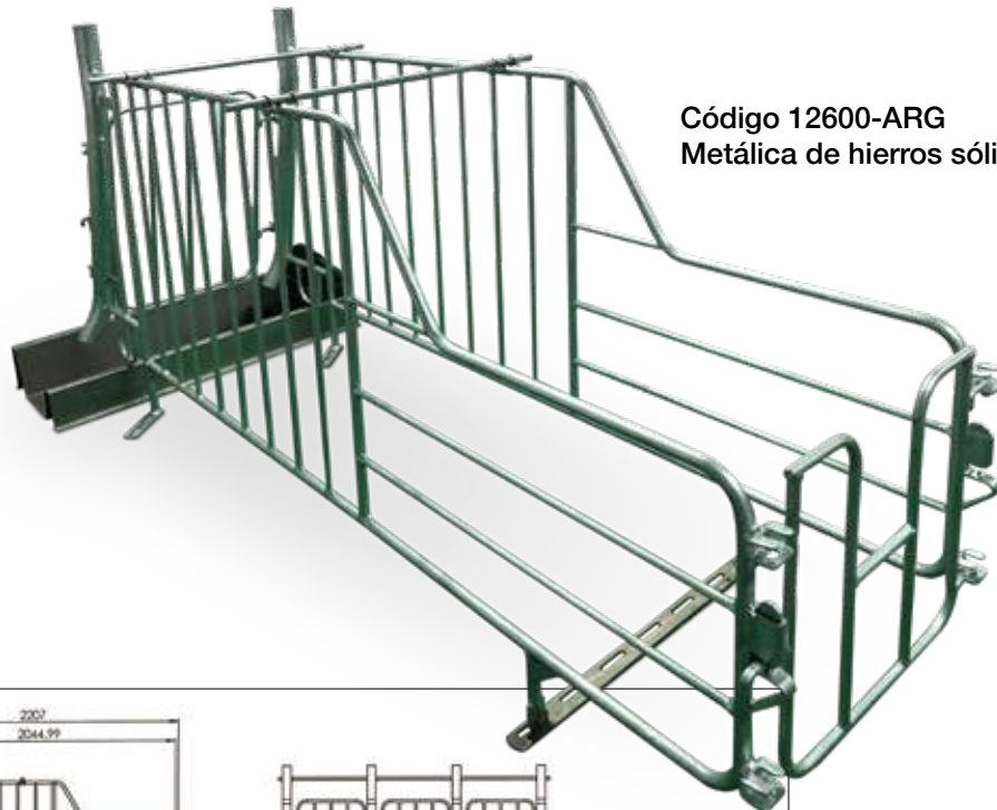
Código 12600-ARG Metálica de hierros sólidos.